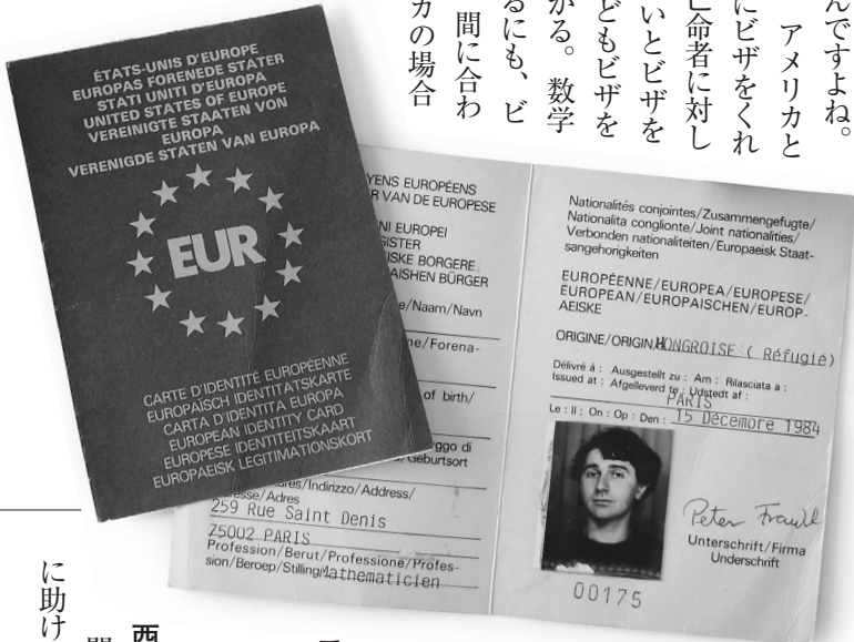
「ヨーロッパ・アイデンティティ・カード」と記された非公式の“EU市民パスポート” (1984年発行)

フランクル そうです。アメリカとカナダはわりと簡単にビザをくれたけれども、日本は亡命者に対しては身元保証人がないとビザを出さない。インドなどもビザをもらうのに3カ月かかる。数学の国際会議に参加するにも、ビザがなかなか届かず、間に合わないんです。アフリカの場合もそう。ぼくの亡命者用のパスポート