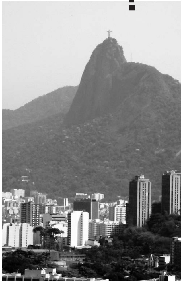
コロコバードの丘に立つキリスト像はリオデジャネイロのシンボルだ