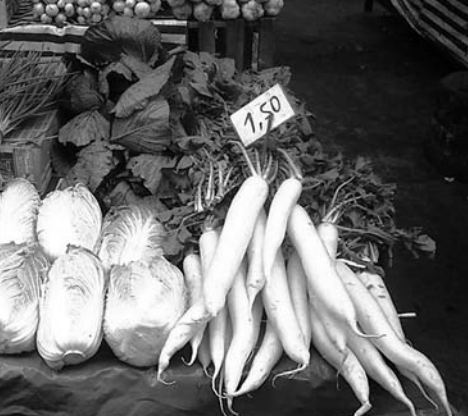
サンパウロの市営市場では日系人が日本人になじみの野菜を売っている