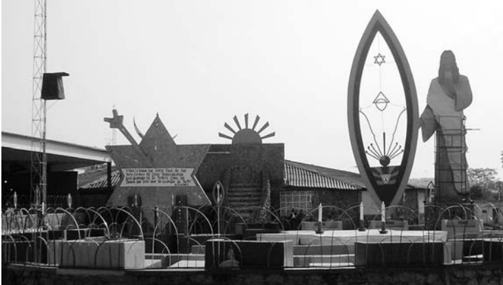
ブラジリア郊外パーレ・ド・アマニエセルの宗教団体の施設