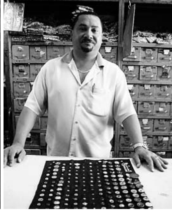
縫製の街、ボン・レチーロのボタン専門店