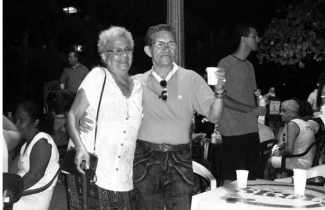
リオデジャネイロ、ラバの街角で歌声に合わせて踊る老夫婦