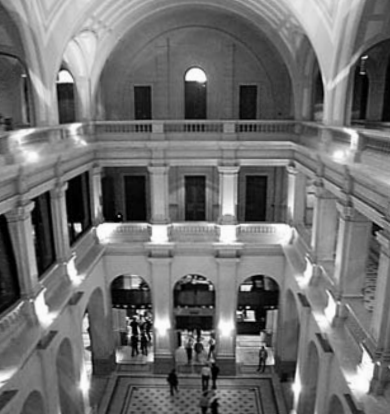
鉄道の駅を改装したサンパウロ・コンサートホールのロビー

『Zupi』は若手グラフィックデザイナー集団が年4回発行するデザイン季刊誌。日本的なモチーフを用いた作品がよく見受けられる