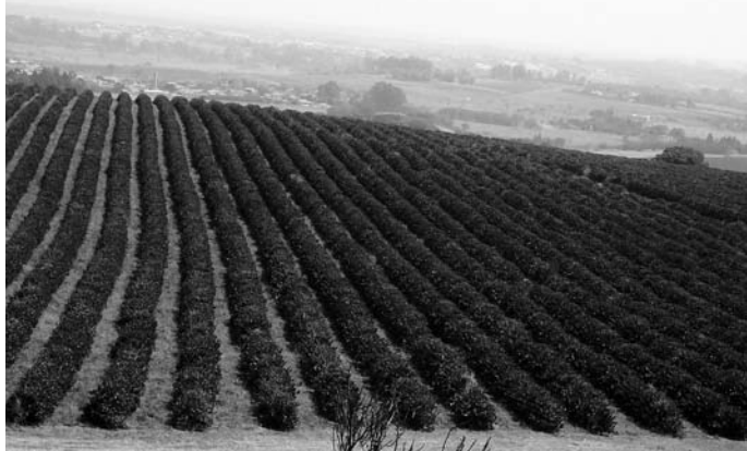
カンピーナスの東山農場にひろがるコーヒー園